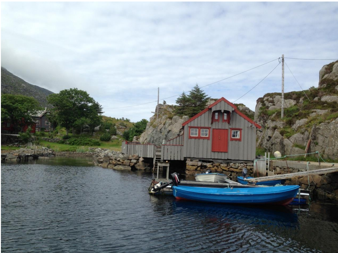
Batalden, Flora kommune